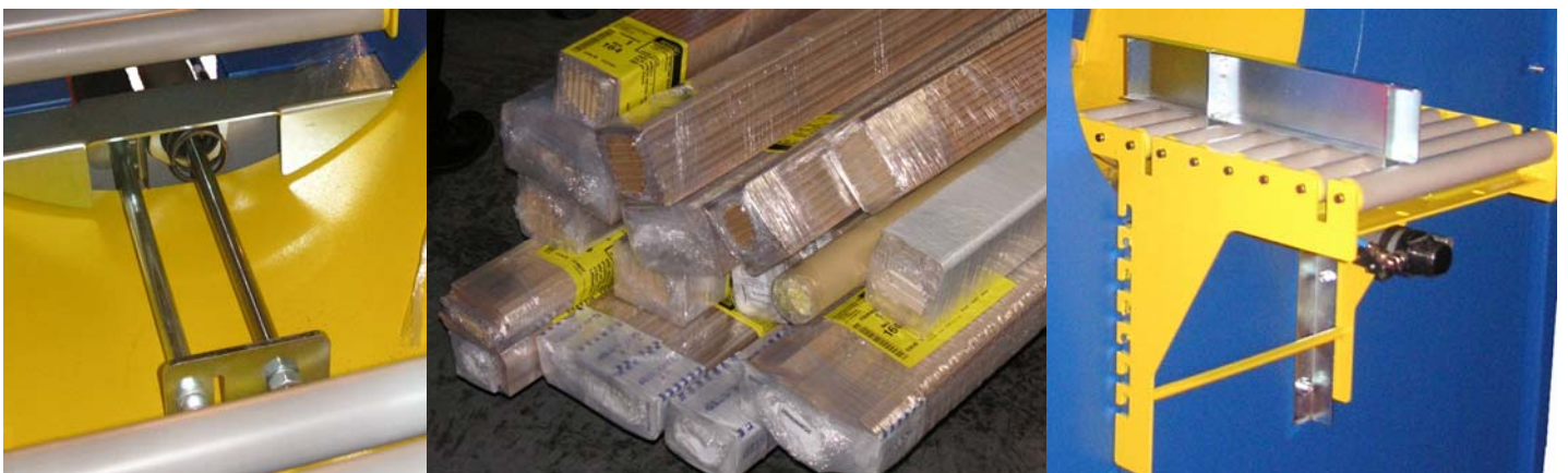
EasyWrap™ FV205 Halbautomatische, vertikale Kleinbündelwickelmaschine